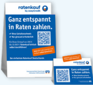
Aufsteller A4 hoch und A6 quer

Das Werbemittel Ellipsenaufsteller (Höhe 200cm) erhalten Sie auf Nachfrage .