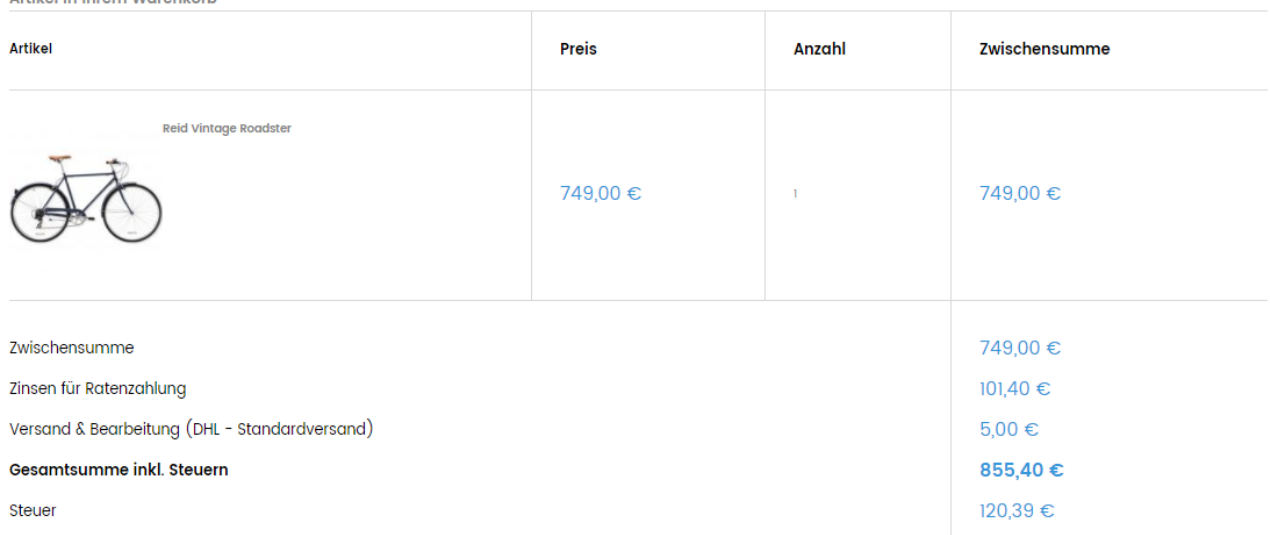
Abbildung 3 Mögliche Darstellung der aus dem Ratenkauf entstehenden Kosten

Sofern der Kunde die Bestellung unter Inanspruchnahme des Ratenkaufs abschließend tätigt, ist dies vom Webshop beim Ratenkauf-System für diesen Vorgang zu bestätigen.